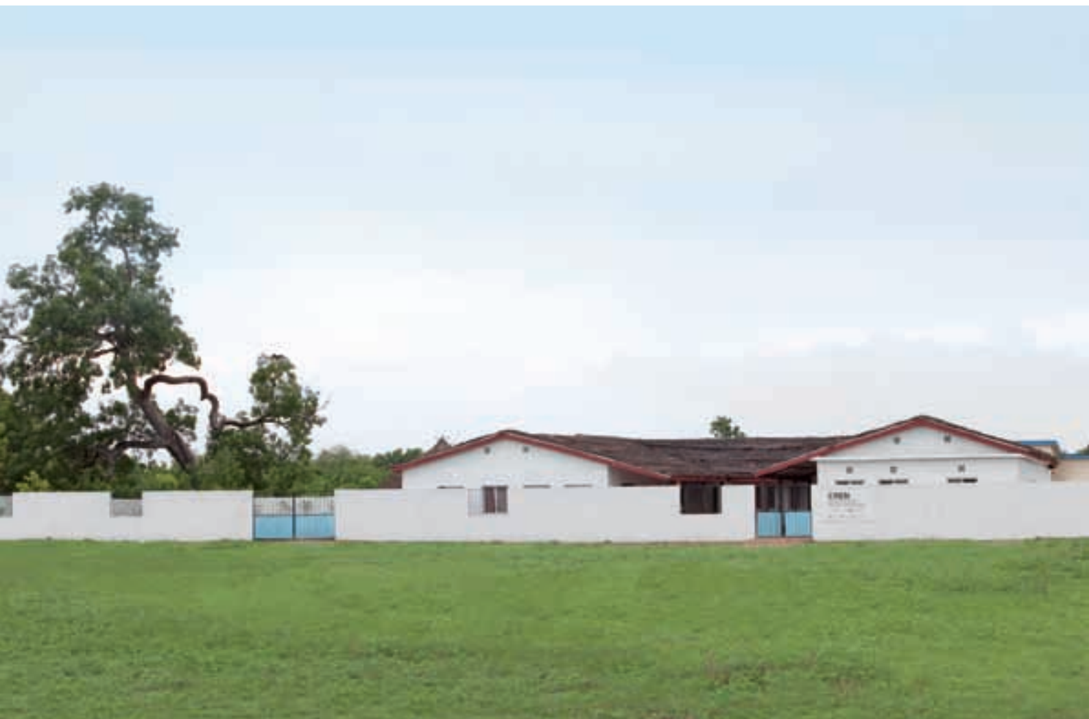
VISTA GENERAL DEL CREM