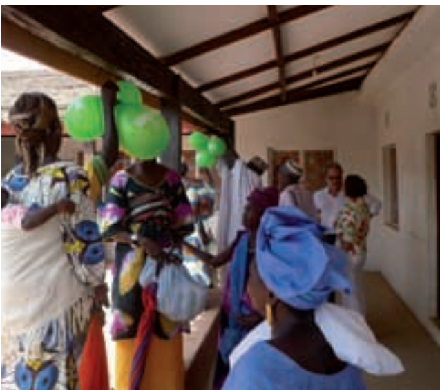
IMATGES DE LA INAUGURACIÓ DEL CENTRE DE RECUPERACIÓ I EDUCACIÓ NUTRICIONAL (CREN) EL 7 DE DESEMBRE