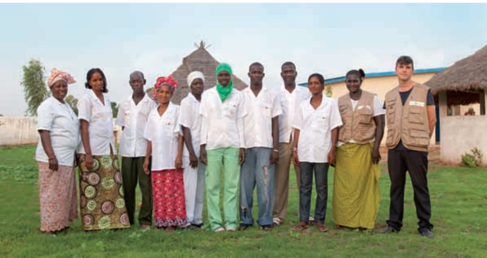
PERSONAL DEL CREM