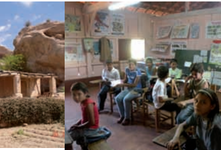
Imatges d'algunes escoles d'Argentina, Paraguai i Uruguai

Durant l'any 2010 s'ha avaluat la problemàtica nutricional de cada escola (segons la zona geogràfica) i s'ha dissenyat el projecte d'intervenció.