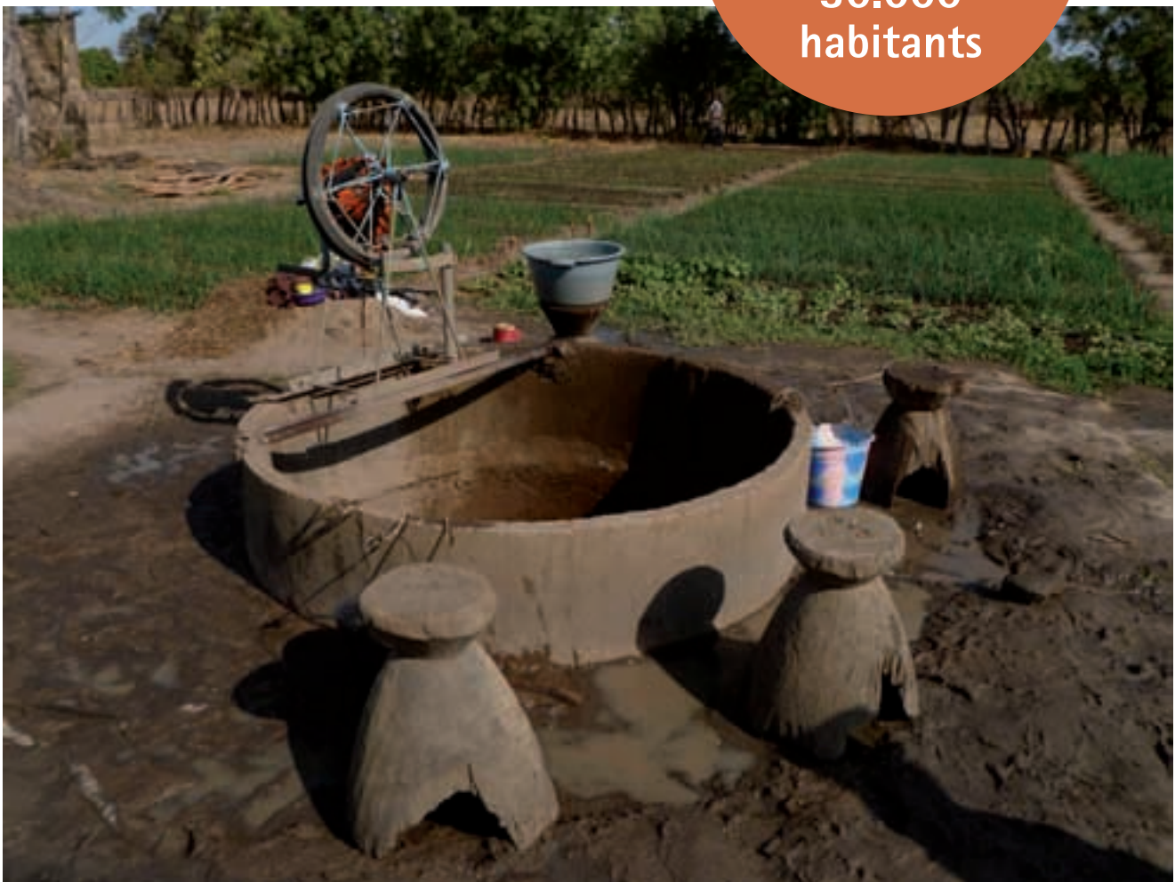
Pou remodel·lat i vista general d'un hort comunitari

Hem promocionat els cultius sostenibles en poblats seleccionats de la zona 30.000 habitants