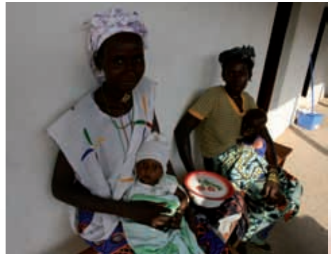
MARES AL CREN