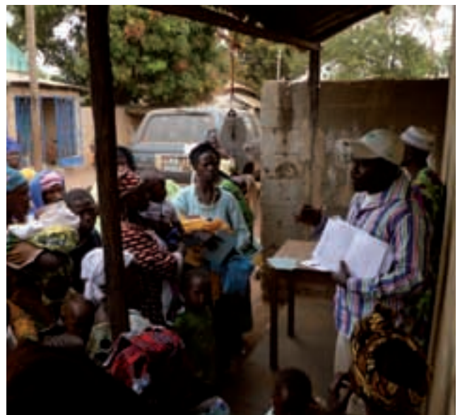
Imàtges dels screenings: el·laboració de la fitxa mèdica, pesada i medicació dels nens/es.