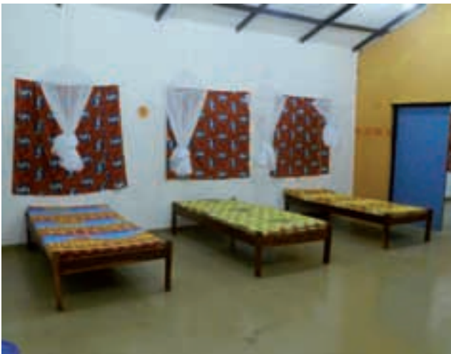
HABITACIÓ DEL CREN

200.000 persones beneficiades indirectament del projecte