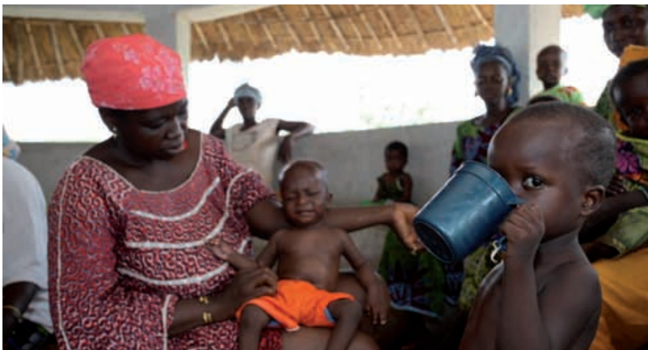
Mares cuidant als seus fills/es desnodrits en el CREN