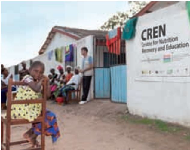
ENTRADA AL CREN

350 Nens de 6 mesos a 59 mesos desnodrits Pes/Talla.